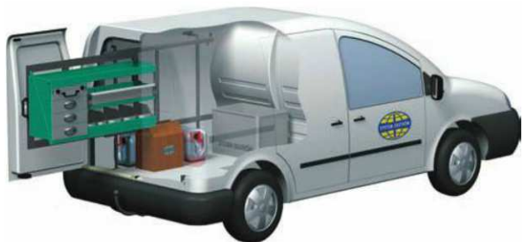
Wysuwane ramy modułowe

Rekomendowane ceny sprzedaży. Obowiązują od 2014-01-01 do odwołania. Podane ceny nie zawierają podatku VAT oraz kosztów montażu. Orientacyjny czas składania regału dla doświadczonego monterza.