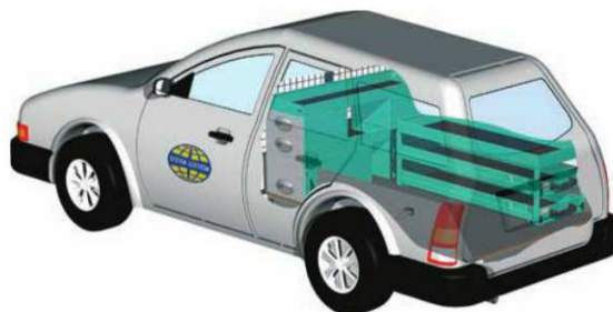
Wysuwane podesty / podłogi